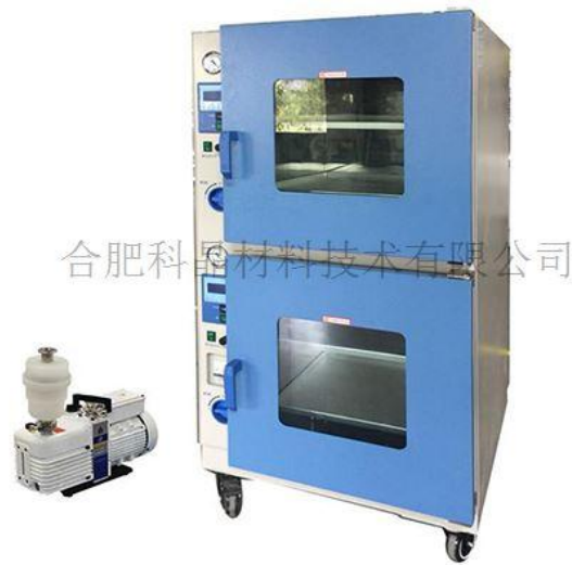
图片仅供参考，以实物为准

DZF-6090-2 型烘箱是一款双层结构独立控温式真空干燥箱。单层腔体容积为 90L，总容积达 180L，每层箱体可独立加温、独立进行抽真空操作，具有真空度保持好，控温精度高，物料腔温度均匀性好的特点。本产品适用应用于锂离子电池生产与研发工艺，进行极片和电池的真空烘烤。也可用于电子产品生产工艺的真空干燥处理，可同时满足不同试验条件下的实验对比。